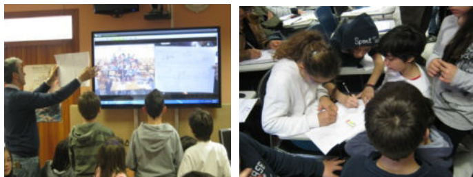
Εικόνα 1. Συνεργασία τοπικής και απομακρυσμένης τάξης

-τα παιδιά της απομακρυσμένης ομάδας προσπαθούν σε πρότυπα εικονογραφημένων σεναρίων σε φύλλα Α3 να σχεδιάσουν το σενάριο που είχε ήδη αναφέρει η αντίστοιχη ομάδα της άλλης τάξης. Δείχνουν το δικό τους εικονογραφημένο σενάριο και γίνεται αντιπαραβολή και συζήτηση με το έτοιμο εικονογραφημένο σενάριο της αντίστοιχης ομάδας (εικόνα 1).