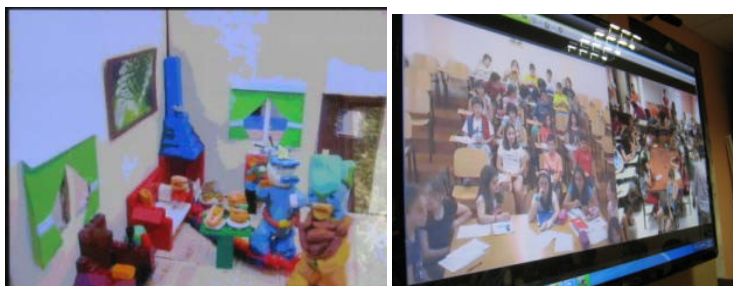
Εικόνα 2. Παρουσίαση εργασιών των μαθητών

-κάθε ομάδα αναλαμβάνει να παρουσιάσει τη δική της θεματική ενότητα. Η παρουσίαση γίνεται με animation (εικόνα 2)