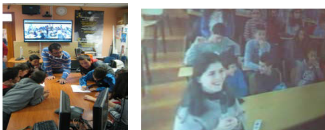
Εικόνα 5: Συνεργασία μαθητών και δασκάλων

- Τα παιδιά συζήτησαν σε ομάδες (από τοπική και απομακρυσμένη τάξη) ανταλλάσσοντας ιδέες για τον τρόπο με τον οποίο σκέφτονται να ικανοποιήσουν την επιθυμία του ΚΑΠΕΤΑΝ ΣΟΣ για την συγγραφή ενός συνεργατικού παραμυθιού.