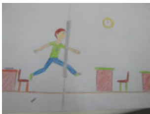
Εικόνα 6: Η απεικόνιση των συναισθημάτων ενός μαθητή σχετικά με τις τηλεδιάσκεψεις

ψυχολογικό κλίμα της τάξης. Στην τελετή λήξης των σχολείων απονεμήθηκαν στους μαθητές των δύο σχολείων που πήραν μέρος στις τηλεδιασκέψεις, έπαινοι ως ενθύμιο.