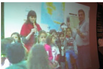
Εικόνα 3: Εισαγωγικές δραστηριότητες μαθητών

Η 1 η τηλεδιάσκεψη ξεκινά με εισαγωγικούς χαιρετισμούς, καλωσόρισμα κλπ. Αμέσως μετά οι μαθητές με τη βοήθεια του Power Point παρουσιάζουν τις ενότητες (ΠΟΛΗ-ΣΧΟΛΕΙΟ-ΤΑΞΗ) και ακολουθούν οι πρώτες διευκρινιστικές ερωτήσεις (εικόνα 3).